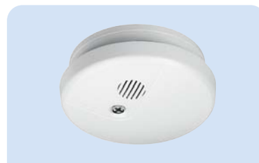
500IDT Art.Nr. 12 020

Im Alarmfall ertönt das Warnsignal aus allen CHOR-E Meldern auf beiden Alarmlinien. Auslösendes Gerät wird durch LED angezeigt. Die Rückstellung erfolgt automatisch.