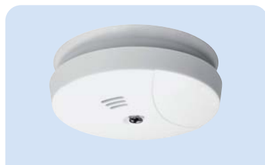
CHOR-E Art.Nr. 12 017

LED-Statusanzeigen • Linien • Ausgänge • Zentralen