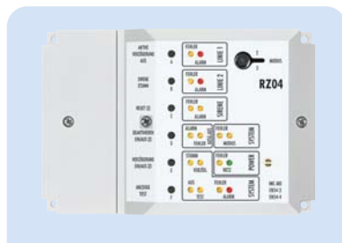
RZ04 Art.Nr. 12 055