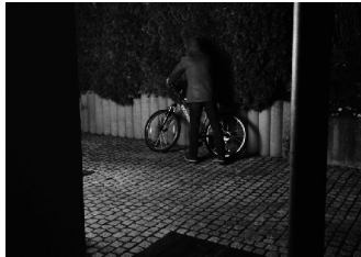
Strahler auf Hintergrund gerichtet