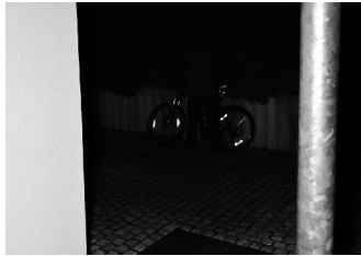
Helles Objekt im Vordergrund bestrahlt